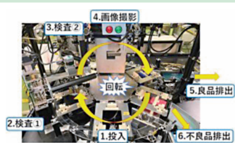
開発課題実習最優秀賞 溶接ボルトスパッタ自動判別装置の開発